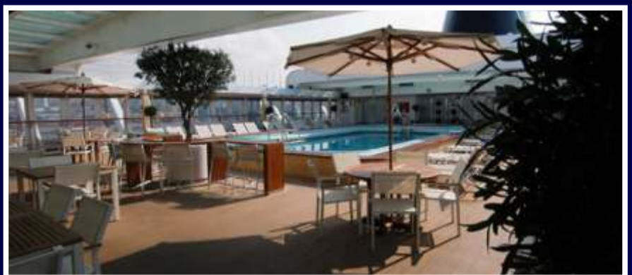
Duas piscinas compõe as demais áreas de lazer e entretenimento do Bleu de France