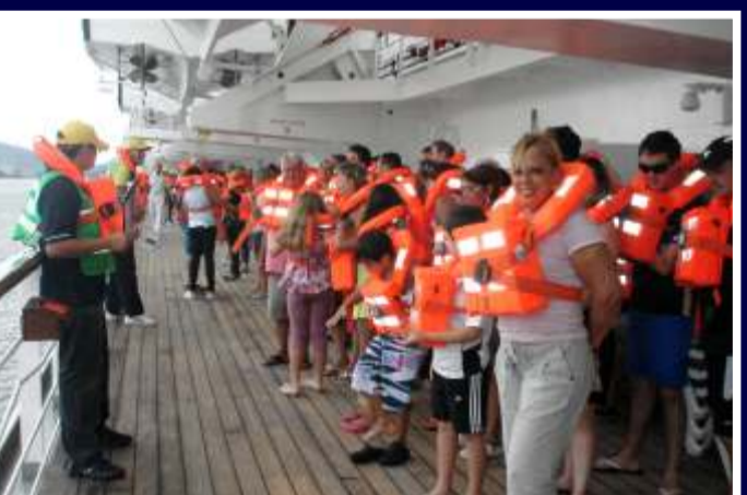
No porto de Santos, a bordo do Bleu de France, o treinamento emergencial obrigatório